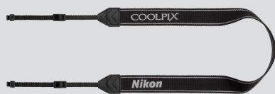
Ремень фотокамеры AN-CP21