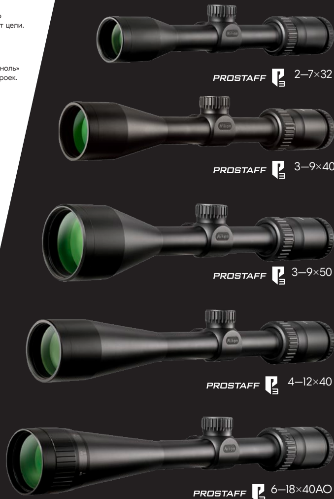
PROSTAFF P3 2-7×32