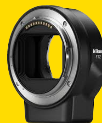
ПЕРЕХОДНИК БАЙОНЕТА FTZ (JMA901DA)