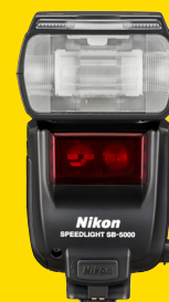
ВСПЫШКА SPEEDLIGHT SB-5000 (FSA04301)