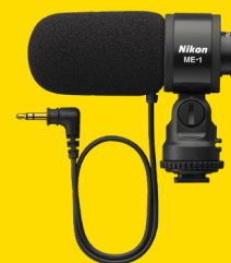
МИКРОФОН ME-1 (VBW30001)